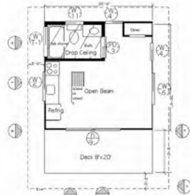
Custom Home Design