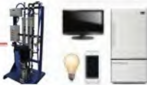
Fresh Water - Appliances