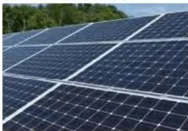
Solar Power System